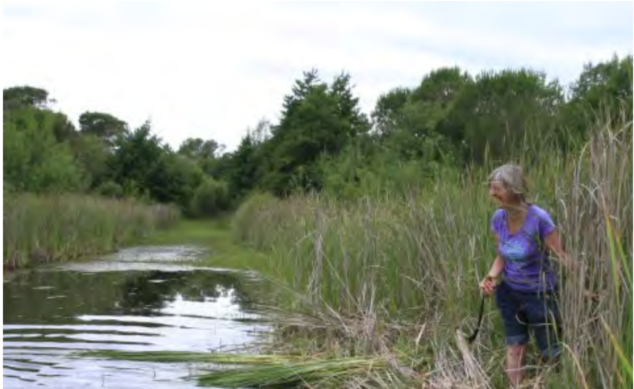
Tallant balca a Cruilles (Baix Empordà). Autor: Josep Mercader.

A part d'embarcar cadires, la balca també pot tenir altres usos com fer corda, folrar ampolles, barrets, etc. No només se'n fan servir les fulles; a Pals s'usava el berriscol dels pursos (inflorescències) per fer el farcit dels coixins.