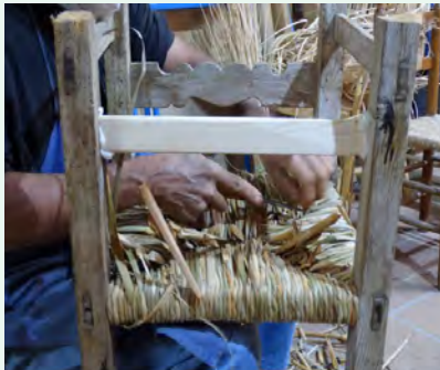
11. Amb un ganivet es tallen les fulles sobrants i es va polint.