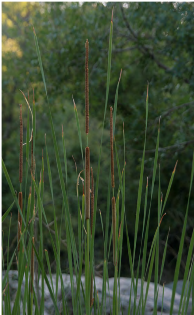
La balca és una planta que viu en llocs inundats com poden ser rieres o basses.