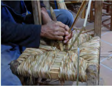
9. Es van fent passades i cap al final queda un espai molt petit on el punxó gruixut ens ajuda a fer les últimes passades.