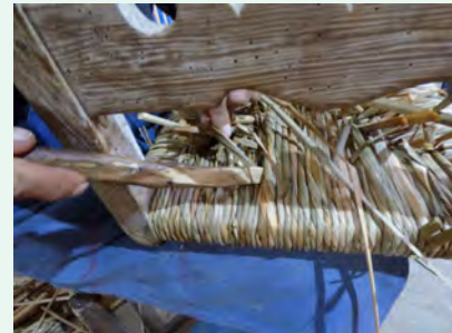
10. Un cop el teixit és acabat s'encoixina per sota amb l'ajuda de l'espasa, tot omplint de fulla de balca l'espai buit que encara ha quedat al mig.