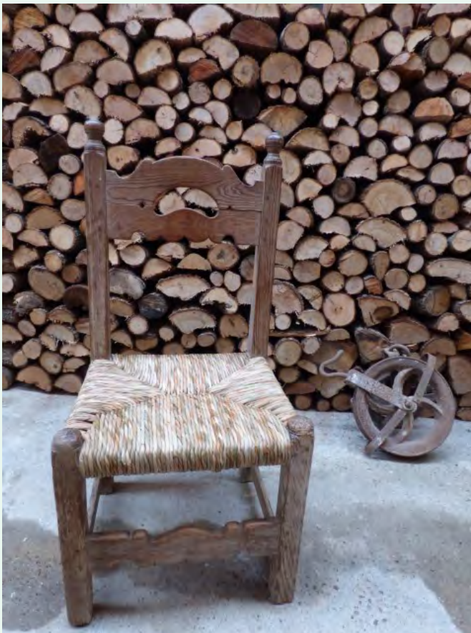
13. Ja tindrem la cadira «en davantal» llesta!