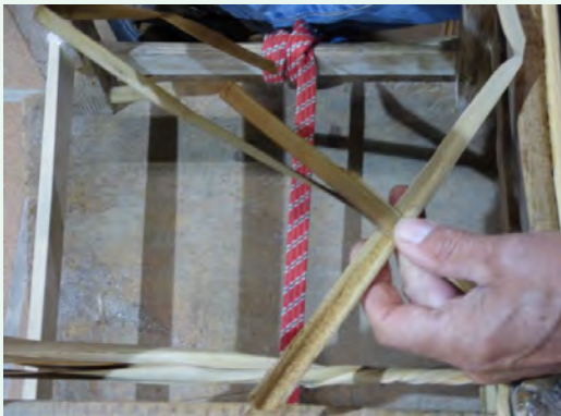
4. Quan s'acaba una fulla se n'hi afegeix una altra per tal de mantenir sempre el mateix gruix de cordill.