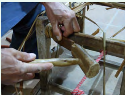
6. A mesura que anem fent s'ha d'ajustar l'embarcat amb la maça i l'escarpra perquè no s'afluixi.