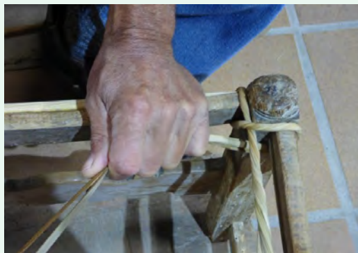
5. Es va passant el cordill d'esquerra a dreta girant la cadira, sempre entrant-lo per sobre i fent-lo sortir per sota. Cal mantenir una certa tensió al cordill perquè no s'afluixi