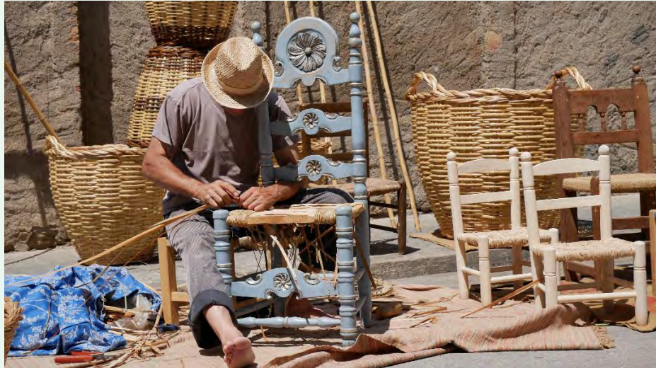
Demostració d'embarcar a la Fira del Vapor (Sant Vicenç de Castellet). Autor: Josep Mercader.