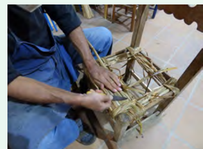
8. Per fer el seient més molsut i resistent, s'encoixina. Es tallen fulles de balca a mesura que es van encabint, amb l'ajuda del ganivet, a l'espai que hi ha entre la part de sobre i la de sota; mentre l'anem entrant per sobre del barrot i el fem sortir per sota, el cordill deixa aquest espai, que cal omplir.