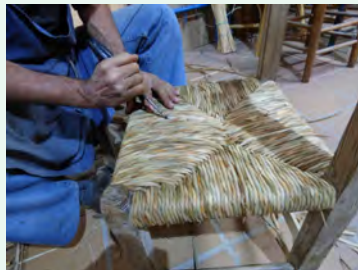
12. Llavors s'acaba pentinant els fils per sobre amb el punxó (a) i planxant-los amb la maça (b).